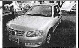
VW/GOL 2011 1.0 8V FLEX C/AR-COND. R$24.800,00

FORD/ECOSPORT XLT 1.6 FLEX COMPLETA GM/ASTRA GSI 2.0 2005 COMPETO FLEXPOWER RENAULT/SANDERO STEEPWAY 1.6 2009 VW/GOL 1.0 2011 C/AR CONDICIONADO 4P FIAT/PALIO 1.4 2013 COMPLETO FORD/FIESTA 2006 C/DIR. HIDRAULICA GM/VECTRA GLS 2000 COMPLETO GM/MERIVA JOY 2007 COMPLETA